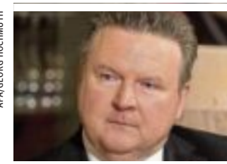
... und verärgert damit Wiens Bürgermeister Michael Ludwig

Der Städtebund begrüßt den Umsetzungsakt zwar „als ersten wichtigen Schritt“. Aber: „In der Umsetzung muss es darum gehen, Städte und regionale Zentren aktiv einzubinden“, so Ludwig, „denn leider fehlte der Mut, die Bedeutung der Städte und Stadtregionen auch für die gesamte Region entsprechend