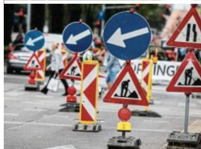
In den Herbstferien kann es am Gürtel zu Staus kommen

Der ÖAMTC rechnet mit Staus vor allem am Äußeren Gürtel, auf Querverbindungen wie Felberstraße - Stollgasse, Hütteldorfer Straße - Urban-Loritz-Platz und Mariahilfer Straße. Auch am Inneren Gürtel muss man sich in Geduld üben. Die Experten empfehlen, den Bereich großräumig zu umfahren. Der KURIER liefert einen Überblick, an welchen Stellen es hakt: